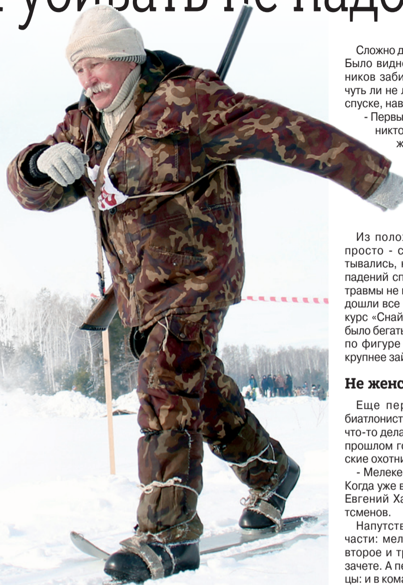
■ Основная часть спортсменов была в возрасте около 40 лет, но были и опытные охотники за 60.