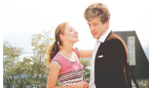
10.00 Новости дня. 10.15 ПИЛОТ МЕЖДУНАРОДНЫХ АВИАЛИНИЙ. 16+