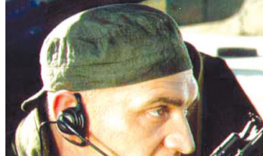
Элита российских войск, специальное подразделение ГРУ. Бойцам и офицерам этого отряда необходимо выполнять важнейшие задания в разных точках мира, рискуя жизнью.