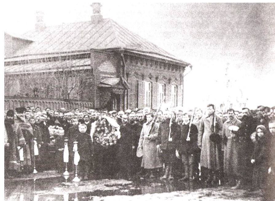
■ Похороны борцов с чапановцами в Сызрани.

...В Карсуне в одном из парков находится братская могила 64 коммунистов и других активных защитников Советской власти, павших в борьбе с контрреволюцией в Карсуне и окрестностях села. Подобный же мемориал есть в селе Большая Кандарать. Но, может быть, нам нужно вспомнить и тех, кто сражался по другую сторону? Ведь это были простые крестьяне, наши с вами деды и прадеды.