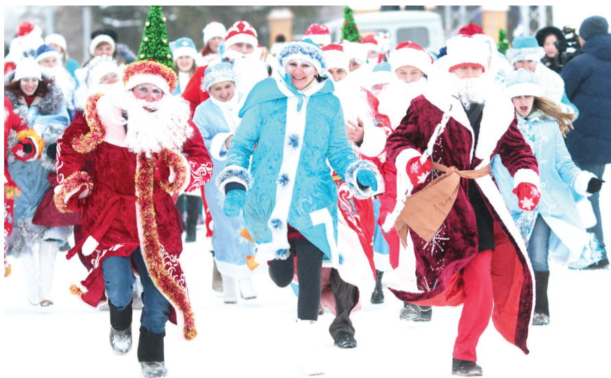
■ А сколько Дедов Морозов и Снегурочек мы видели в этом году... Сбились со счета! Съезд главных новогодних героев в Сенгилее прошел на ура!

■ Год театра в Ульяновске начался с ярких премьер, среди них - спектакль «Много шума из ничего». Опять Шекспир? Да! Но таким мы его еще не видели.