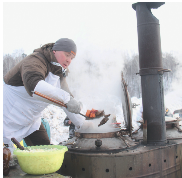
■ Шулюм (охотничья похлебка) достался и участникам, и зрителям.