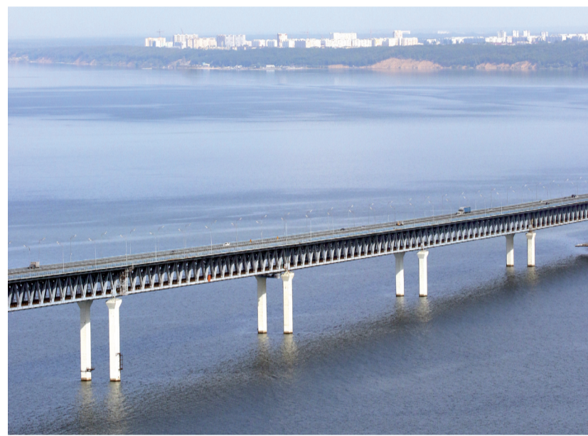
■ Около миллиарда рублей собираются потратить на оздоровление Волги.

Лечить нужно не только Волгу, но и (временами) каждого из нас, а со здравоохранением пока все не так гладко. Кризис отрасли начался еще летом минувшего года, и, несмотря на значительное снижение долгов учреждений, окончившимся его называть преждевременно. Здравоохранению региона из федеральных