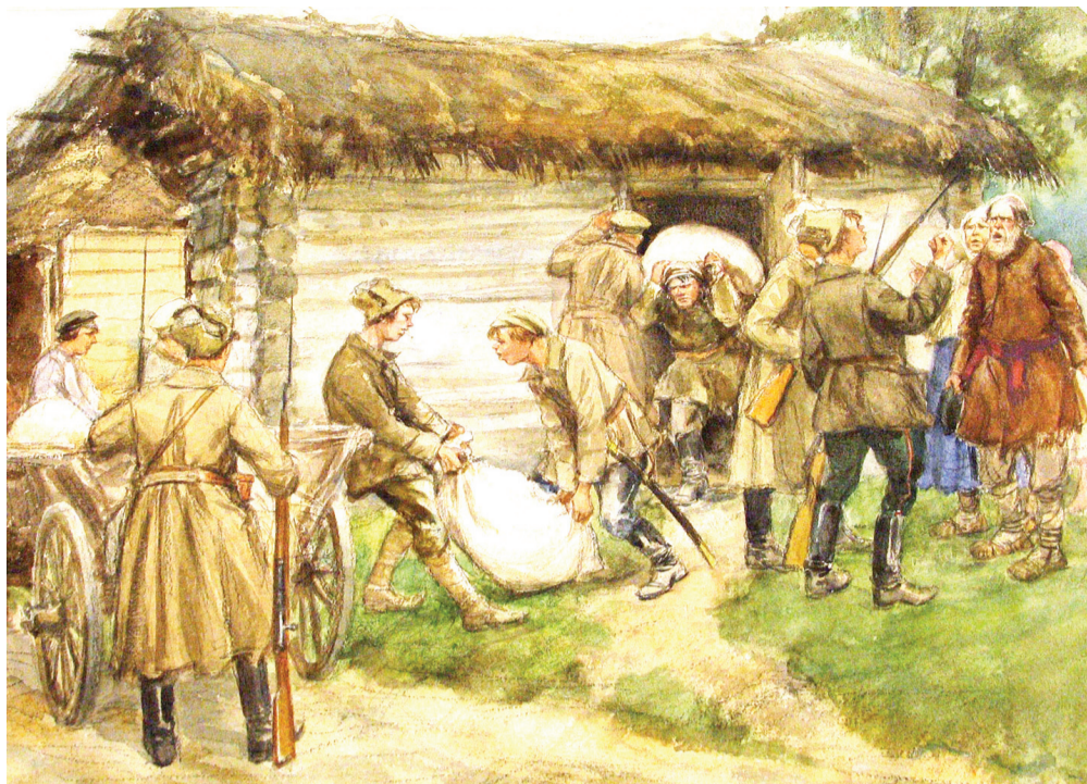
■ Реквизиция хлеба у крестьян стала главной причиной чапанного восстания.

В Самаре была сформирована Южная группа войск Восточного фронта под командованием Михаила Фрунзе. В ее задачи вошла борьба с наступающими колчаковцами и повстанцами. Натиск красноармейцев крестьяне долго выдержать не могли и стали расходиться по домам. После упорных уличных боев Ставрополь отбили 13 марта, на следующий день взяли Новодевичье.