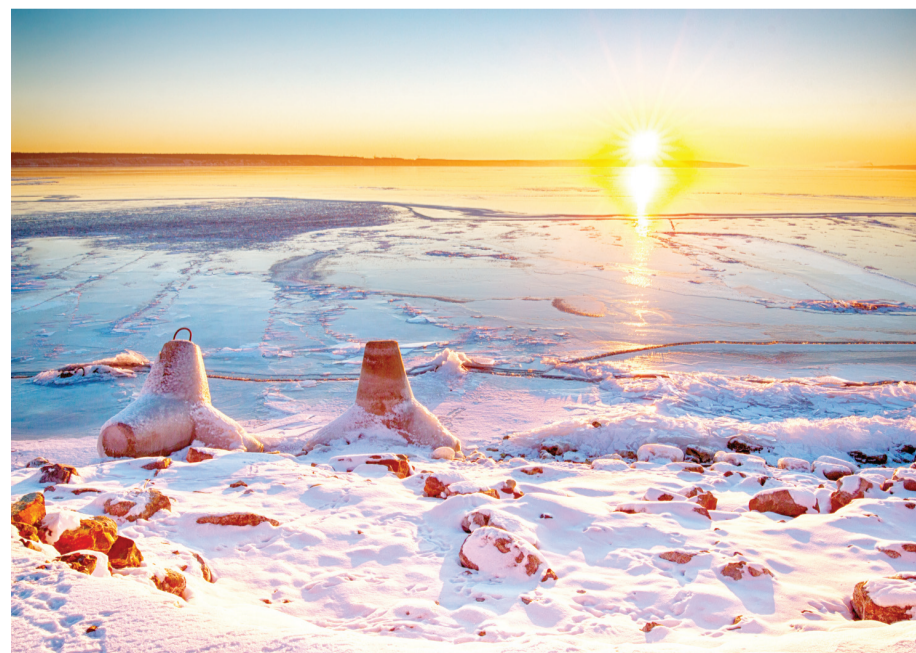
■ Зима-волшебница создает такие пейзажи, которые и не снились великим художникам. Эта фотография сделана в первый день декабря.