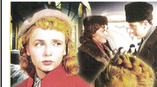
17.05 Пешком... Док. фильм. 17.35 Красота по-русски. 18.30 Романтика романа.