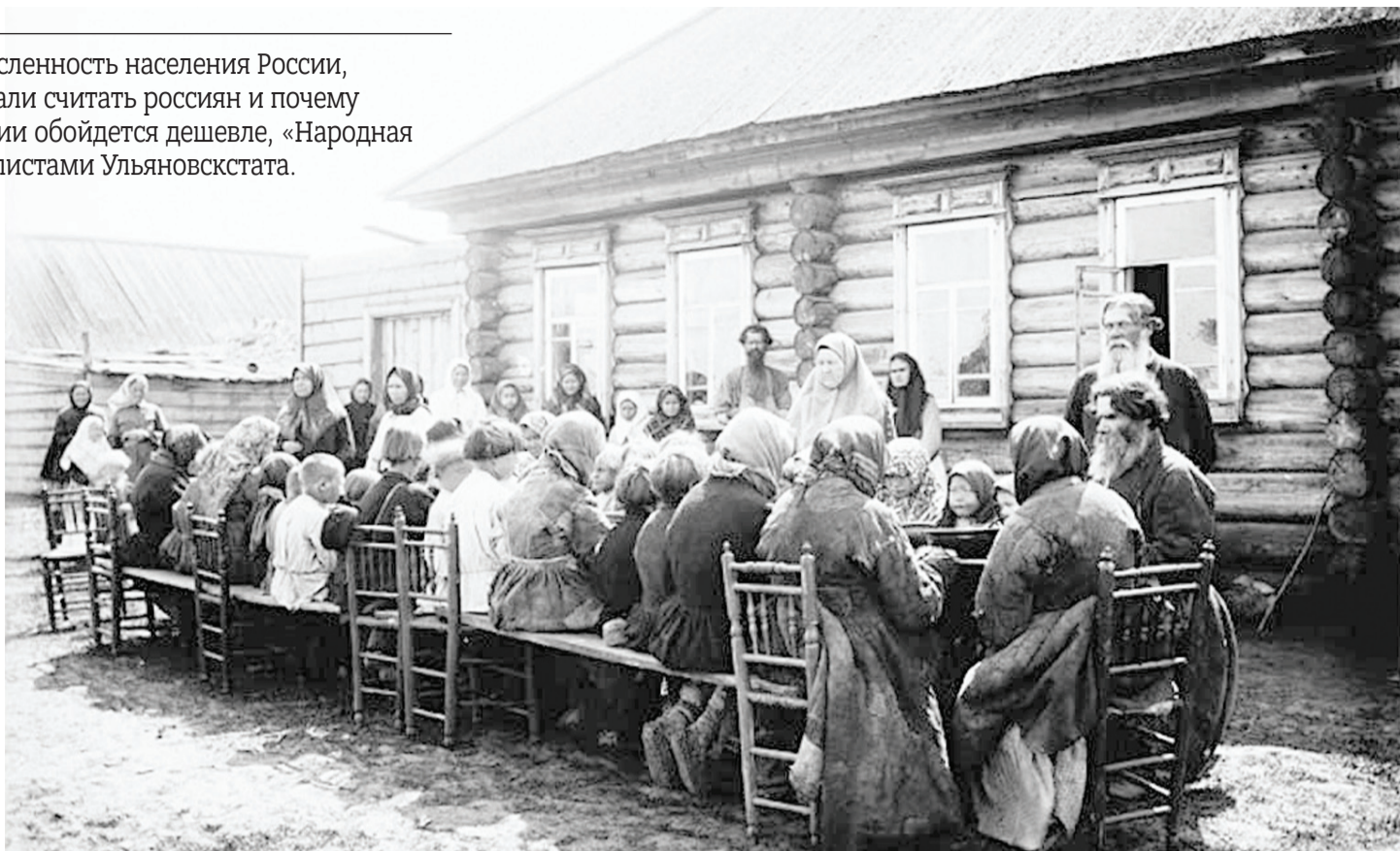
■ 9 февраля 1897 г. стартовала первая полная перепись населения Российской империи. По данным переписи, население России в ту пору насчитывало 125,6 млн человек.

К этой процедуре привлекли каждого жителя империи: «обою пола, всякого возраста, состояния, вероисповедания и племени, как русских подданных, так и иностранцев», сообщает «История Российской империи». Каждый должен был ответить на 14 вопросов: имя, пол, возраст, сословие