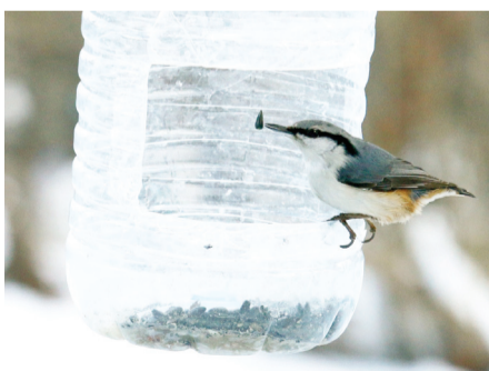
■ Добрые дела надо делать круглый год. А вы покормили птичек в сквере около дома?