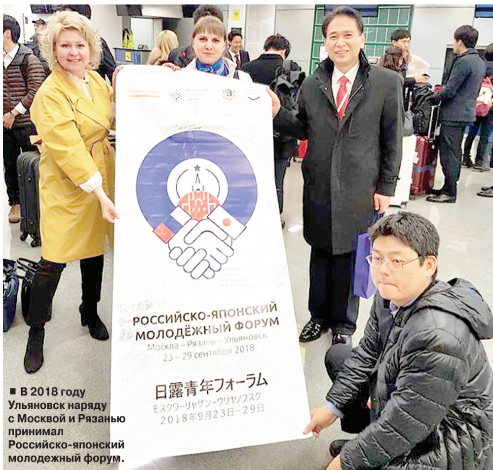
■ В 2018 году Ульяновск наряду с Москвой и Рязанью принимал Российско-японский молодежный форум.

РОССИЙСКО-ЯПОНСКИЙ МОЛОДЕЖНЫЙ ФОРУМ Москва – Рязань – Ульяновск 23 – 29 сентября 2018 日露青年フォーラム モスクワ-リヤザン-ウリヤノフスク 2018年9月23日-29日