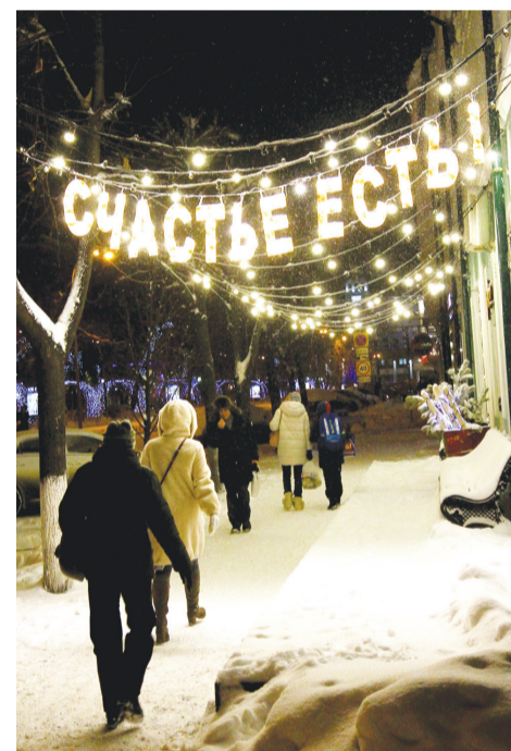
■ Под этой надписью около кафе на Гончарова не сделал фото только ленивый. А ведь простая мысль, но такая согревающая холодной зимой...

■ Какой бы долгой и утомительной ни была зима, сейчас кажется, что три месяца пронеслись как один миг. Мы радовались первому снегу, ждали Новый год, подкармливали птичек в парке, вечера проводили в театре... Хорошее время, но впереди многообещающие солнечные дни. Поэтому еще раз вспомним, как пережили календарную зиму, и скажем ей до свидания!