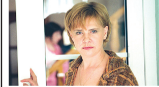
22.05 БОМЖИХА-2. 16+ 0.15 6 кадров. 16+