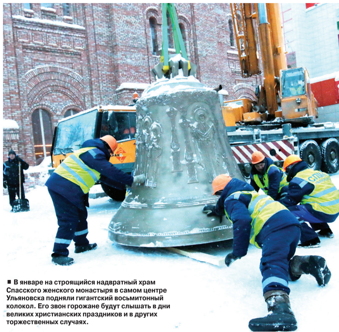
■ В январе на строящийся надвратный храм Спасского женского монастыря в самом центре Ульяновска подняли гигантский восьмитонный колокол. Его звон горожане будут слышать в дни великих христианских праздников и в других торжественных случаях.