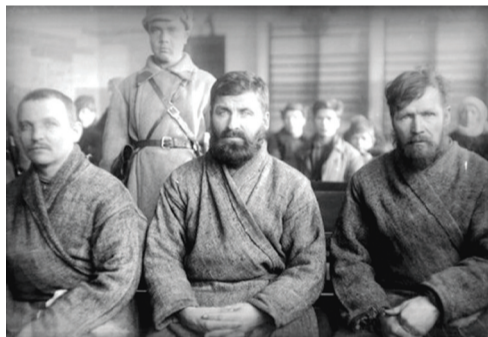
■ Подсудимые на процессе по делу о чапанном восстании. Самара.