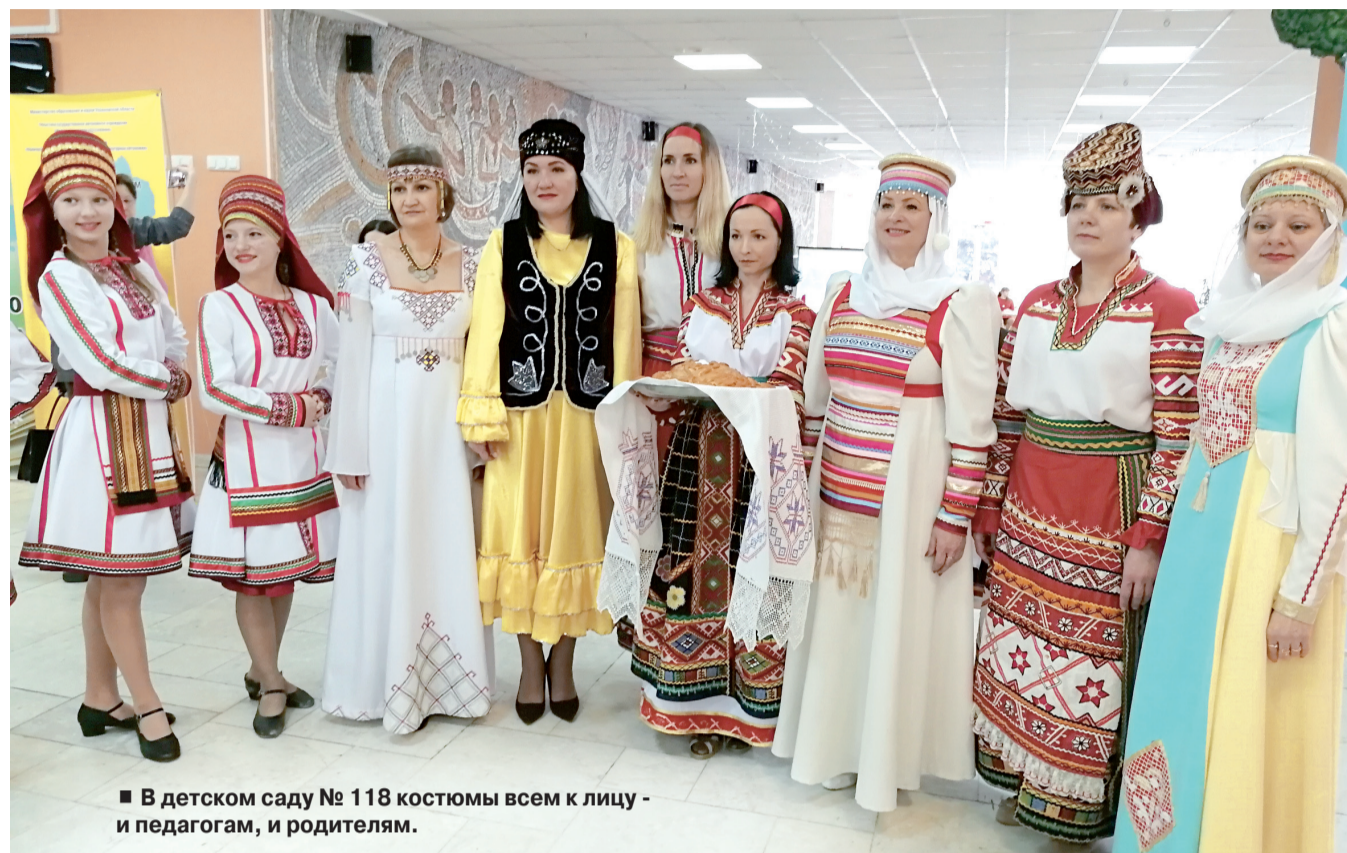
■ В детском саду № 118 костюмы всем к лицу - и педагогам, и родителям.

Как в Ульяновске изучают языки народов Симбирского края