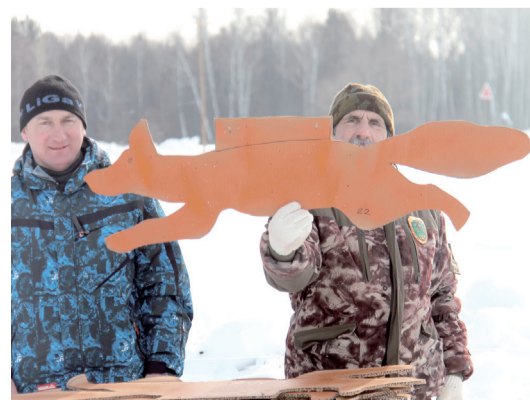
■ Именно такие лисы служили мишенями для биатлонистов.

Сложно давались спуски и подъемы. Было видно, как некоторые из охотников забирались на холм ползком, чуть ли не лежа на лыжах. А падал на спуске, наверное, каждый второй.