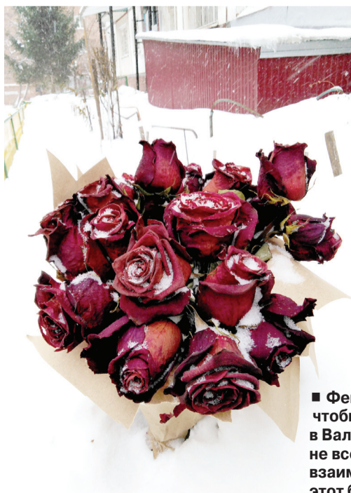
■ Февраль ждут все влюбленные мира, чтобы признаться в своих чувствах в Валентинов день. Но, видимо, 14 февраля не все объяснения в любви были взаимными, и кто-то в отчаянии оставил этот букет роз в снегу на верную погибель.