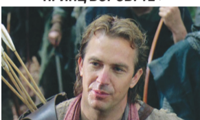
12.30 РОБИН ГУД: ПРИНЦ ВОРОВ. 12+