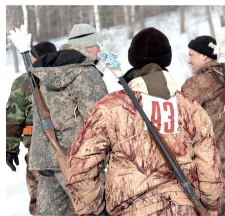
■ Перчатки на стволах - это своеобразные предохранители от снега при падениях.

Потом спортсмены признались нам, что их отношение к соревнованиям менялось по ходу дистанции. Особенно у новичков. Оказалось, что это совсем не легкая прогулка на охотничьих лыжах - здесь все серьезно.